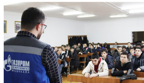
СТУДЕНТАМ – О БЕЗОПАСНОСТИ