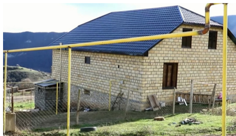
ГЛАВА ДАГЕСТАНА ПОБЛАГОДАРИЛ РАБОТНИКОВ «ГАЗПРОМА»