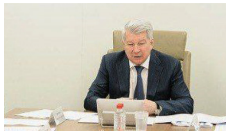
ДОЛГИ ПОТРЕБИТЕЛЕЙ НА КАВКАЗЕ СНИЖАЮТСЯ