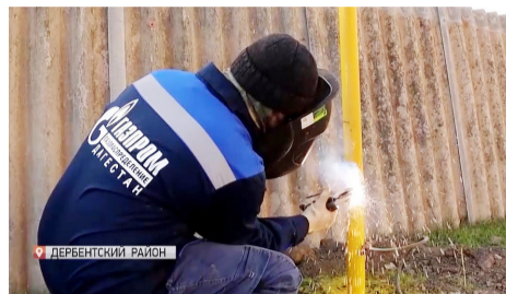
СОЦИАЛЬНАЯ ГАЗИФИКАЦИЯ ПРОДОЛЖАЕТСЯ!